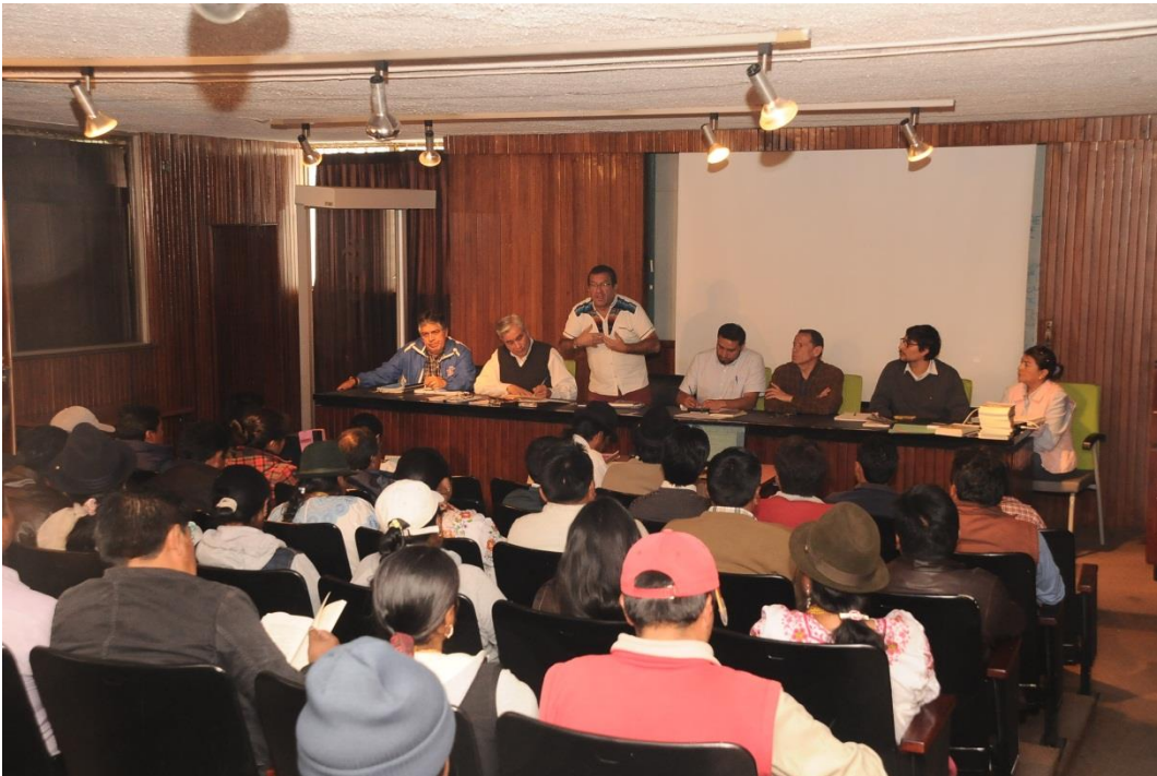
Taller de Socialización Instructivo para conformación y legalización de Juntas Planta Central - Secretaría del Agua