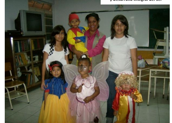
ESCUELA JOSE ANTONIO GALAN I PROYECTO EDUCATIVO RECLUSION LA MAGDALENA