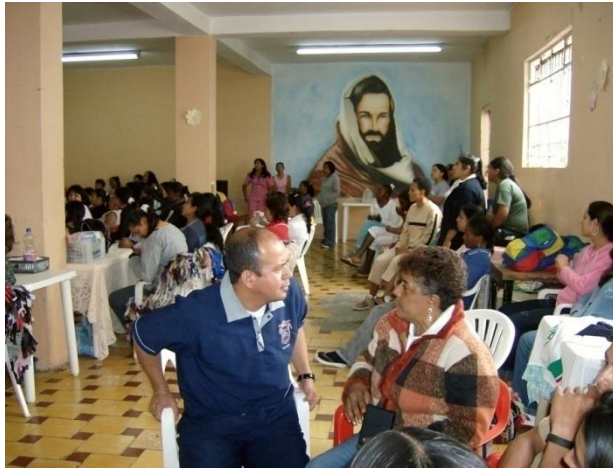
CENTRO DE ESCUCHA RECLUSION LA MAGDALENA POPAYAN